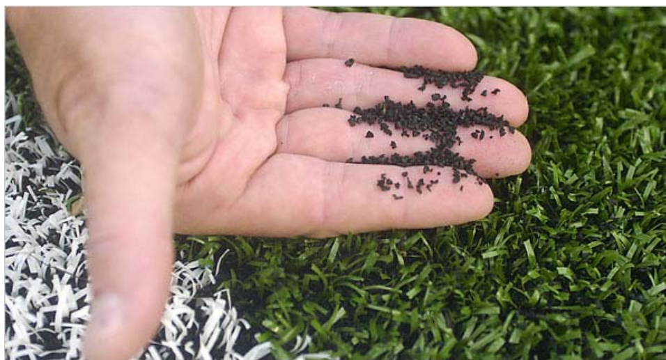
Figure 2. Photographie des matériaux d'un gazon synthétique avec granulats SBRr

Lors du recyclage, les morceaux de pneus sont déchiquetés et on en extrait les morceaux de métal à l'aide d'aimants et la fibre par aspiration. Les saletés sont enlevées par un lavage à l'eau (Recyc-Québec, 2007). Lorsqu'il ne reste que le caoutchouc, celui-ci est broyé mécaniquement, à température ambiante ou à très faible température de façon à produire des « granules cryogéniques » qui ont l'avantage d'avoir une meilleure définition de leur diamètre et ainsi de limiter la production de petites poussières (Kolitzus, 2007). Le diamètre aérodynamique des granules varie généralement de 0,5 à 3 mm pour une même surface de gazon synthétique (Figure 2) (Plessler et Lund, 2004). Les granulats SBR peuvent également être recouverts de polyuréthane afin d'améliorer la couleur (Kolitzus, 2007).